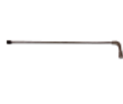
Spatbord / chassislans 3.8007.LCPR29360 (excl. nozzle)