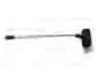
Vaste hydro-borstellans 3.8007.SPID24939