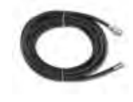
Rioolset 10 m 3.8007.TABP23853